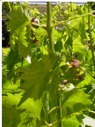
DANOS: En hojitas del brote de crecimiento