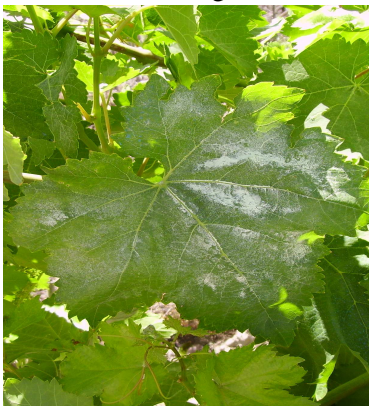
Hoja con mucho azufre.

OIDIO: Recomendaciones: 1.-En viñedos más atrasados, que están en floración, aun se pueden realizar azufrados en polvo. 2.- Los realizados anteriormente están siendo muy útiles, ya que la climatología ha permitido que el azufre permanezca mucho tiempo en la cepa. 3.- Debido a las altas temperaturas soportadas, el azufre ha provocado quemaduras en la vegetación sin repercutir en la cosecha.