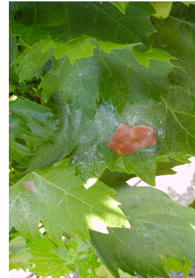
En hojas casqueras

4.- El periodo más sensible al oidio de la vid es desde floración a cerramiento de racimos (racimos apretados) o de inicio de floración a inicio de envero. 5.- En parcelas que suelen presentar ataques de oidio, o en viñedos de variedades sensibles, o cuando las vides están formadas en espaldera hay que extremar el control del oidio. Independientemente de los azufrados realizados, se aconseja tratar con anti-oidio cuando las uvas tienen tamaño guisante. Es importante que el volumen de caldo sea suficiente para cubrir TODA la vegetación.