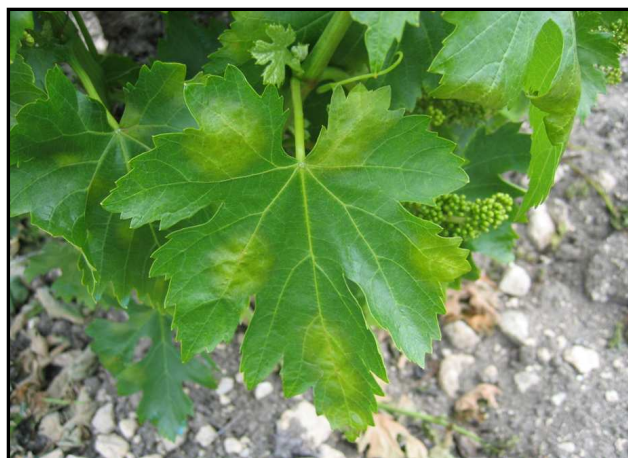
Fot.1. Mancha del Sábado 07/05

Después de 8 o 12 días, según T ras medias.