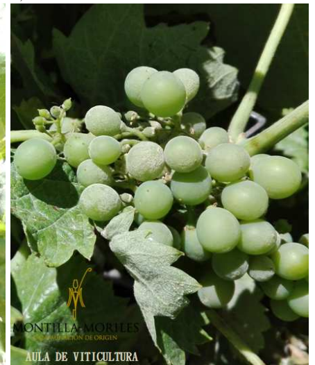
Fot. 3. Oidio en uvas.