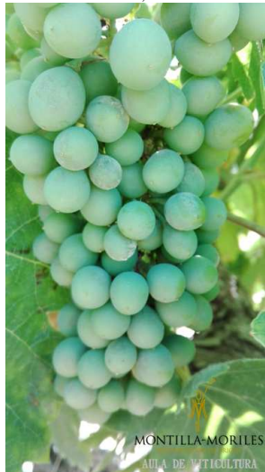
Fot. 1. Oidio en racimo.

Productos: AZOXISTROBIN ,BOSCALIDA + KRESOXIM METIL, CIPROCONAZOL, FENBUCONAZOL, KRESOXIM METIL, MEPTILDINOCAP, PIRACLOSTROBIM, METRAFENONA, MICLOBUTANIL, PENCONAZOL, PROQUINAZID, QUINOXIFEN, TEBUCONAZOL, TRIADIMENOL, TRIFLOXISTROBIN.