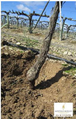
Nivel 0 de franqueo: