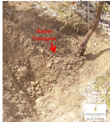
Nivel 1 de franqueo: