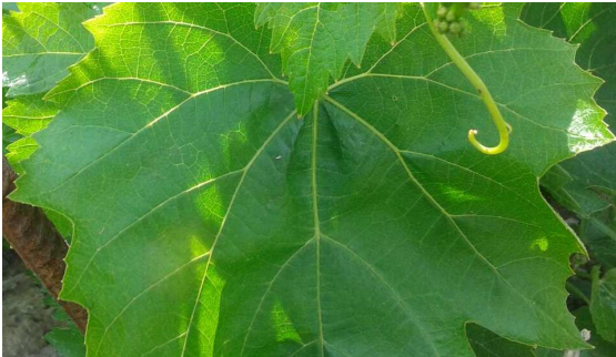
Mancha de mildiu detectada en la mañana del 24/abril/2015 en En Aguilar de la Frontera foto de José Antonio Pérez.