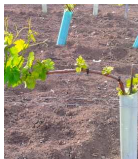
//Brotación irregular en los brazos de // espaldera con vigor.